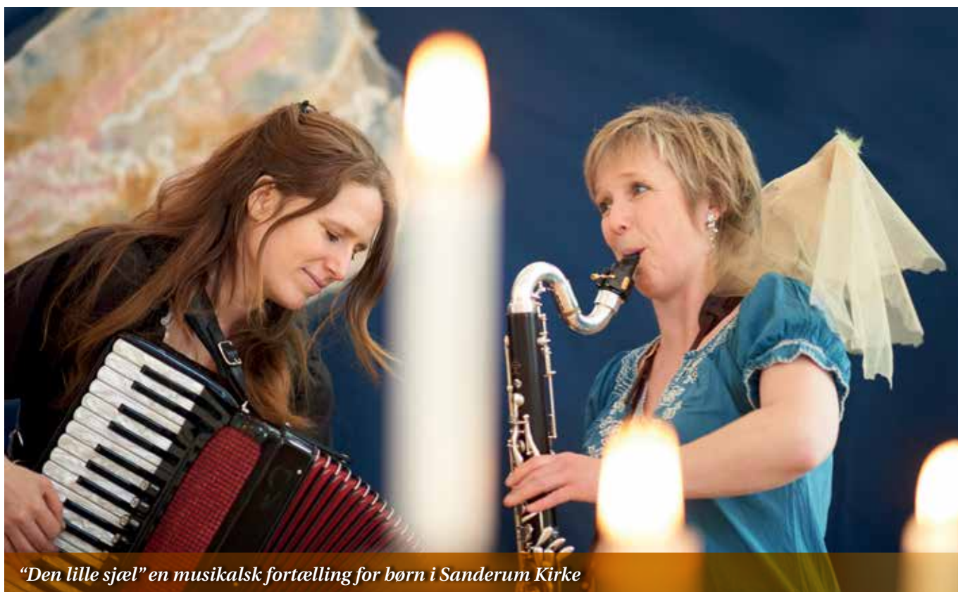
"Den lille sjæl" en musikalsk fortælling for børn i Sanderum Kirke