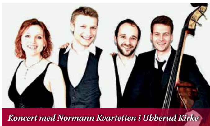
Koncert med Normann Kvartetten i Ubberud Kirke